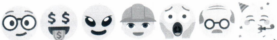
Figura 8 Figura 9 Figura 10 Figura 11 Figura 12 Figura 13 Figura 14