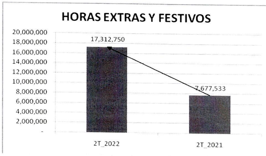
Gráfico Nro. 2